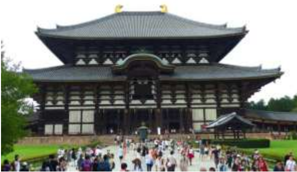
Tempio Todaiji, Nara

Questo tempio buddhista è stato costruito nel 1300