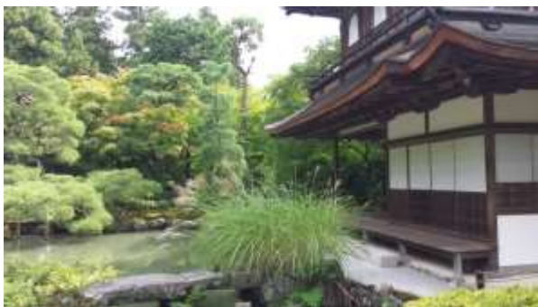
Ginkakuji Temple - Pagoda d'Argento

La città esplode di colori e natura e la passeggiata dal tempio Nanzen-ji al tempio Ginkaku-ji, chiamata passeggiata del filosofo, è emozionante e da non perdere assolutamente. La passeggiata si sviluppa sotto grandi alberi di ciliegio e attraversa numerosi santuari e templi, tutti con rigogliosi giardini che assumono tonalità di colori differenti.