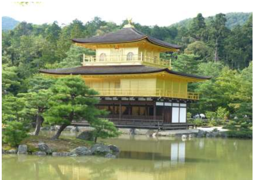
Kinkakuji - Golden Pavilion

Kyoto è detta la città dei Mille Templi e fu capitale del Giappone per più di 1000 anni (dal 794 al 1854). La storia millenaria, la cultura profonda e radicata, le tradizioni e tanto altro rendono Kyoto il vero cuore del Giappone, una città all'avanguardia ma, al tempo stesso, affascinante e misteriosa, semplicemente la meta più bella del Giappone. Qui è possibile scoprire il "vero Giappone", passeggiare nella storia di una civiltà ricca di mistero e tradizioni. Kyoto è la città