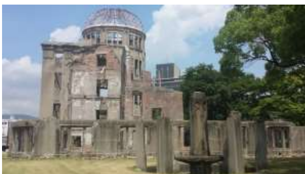
A-bomb dome, Hiroshima

In questo grande parco ogni giorno migliaia di persone da tutto il Giappone e turisti da tutto il Mondo ripercorrono i tragici eventi. Nel parco si trova l'unico edificio rimasto in piedi dopo lo scoppio della bomba (A-bomb dome), il Museo della Bomba e il monumento dedicato alla bambina Sadako Sasaki. Questa bambina si ammalò di leucemia a seguito delle radiazioni e realizzò tantissimi origami forma di Gru perché una leggenda giapponese affermava che realizzare mille gru dava ad ognuno la possibilità di esprimere un desiderio.