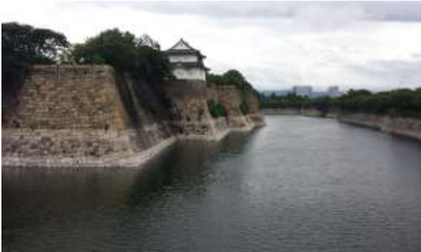
Castello di Osaka

Per raggiungere il Castello è possibile prendere la metro Jr (JR loop) e scendere alla fermata di Osakajokoen.