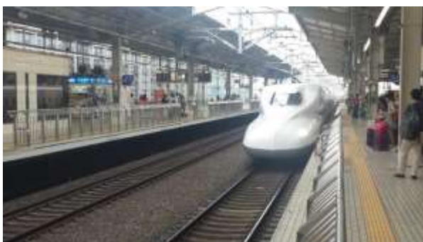
Shinkansen - Treno Proiettile

In particolare se decidete di utilizzare almeno 1 o 2 treni Shinkansen allora l'abbonamento è conveniente, se invece rimanete per molti giorni all'interno delle città principali (Tokyo e Kyoto) allora non sarà conveniente e sono preferibili singoli abbonamenti giornalieri solo per i mezzi di trasporto locali.