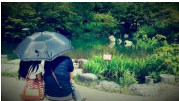
Area dei templi di Higashiyama

Migliaia sono i templi e santuari delle principali religioni della città, buddismo e shintoismo, che si susseguono regalando scorci suggestivi per il turista.