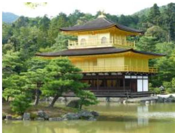
Kinkakuji - Padiglione d'Oro

Il giardino è curato nei minimi dettagli ed è stato realizzato secondo i principi del periodo Muromachi con un'attenzione speciale al rapporto tra edifici e spazio circostante. Il padiglione ha un valore simbolico e rappresenta la purificazione da ogni tipo di pensiero negativo. All'interno sono presenti alcune reliquie del Buddha.