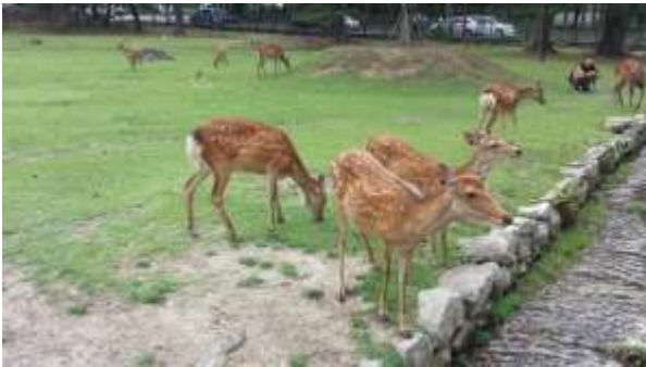
I cervi di Nara

I protagonisti assoluti sono i cervi che girano liberi nel parco, tra i bellissimi templi, e coccolati dai numerosi turisti stupiti.