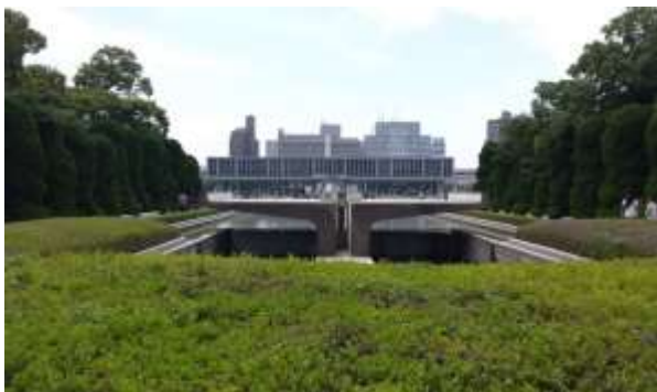
Memorial Park, Hiroshima

Nelle vicinanze di Hiroshima è presente un'altra importante attrazione del Giappone, l'Isola di Miyajima.