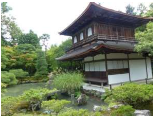
Ginkakuji - Padiglione d'Argento

Il tempio zen si trova nella tranquilla e verde zona di Higashiyama ed è immerso in un giardino curatissimo.