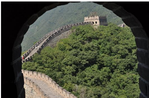
La grande Muraglia di Mutianyu

Arrivati a Mutianyu per salire in cima è necessario prendere una funivia (costo A/R 50 yuan). Mutianyu risale al VI secolo e si estende per 1,6 km. Un altro punto di interesse è Simatai dove è possibile vedere la parte più autentica della Muraglia lontani dalla folla di turisti.