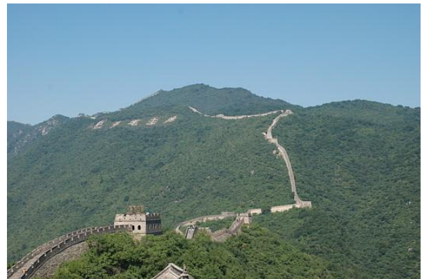
La grande Muraglia Cinese

La Grande Muraglia Cinese è una delle principali meraviglie del Mondo e si sviluppa nella provincia del Gansu per oltre 6000 chilometri. La realizzazione della Grande Muraglia aveva il compito di proteggere il popolo cinese dalle invasioni dei Mongoli e gli Unni. Oggi gran parte della muraglia è andata persa ma alcuni tratti sono ancora esistenti e sono stati parzialmente restaurati.