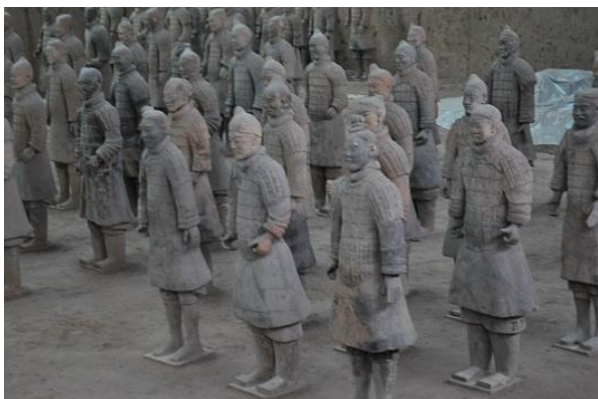
Esercito di Terracotta

Xian è famosa principalmente per l'Esercito di Terracotta portato alla luce solamente 35 anni fa'. Nel 1974 un contadino, mentre stava scavando un pozzo, vide affiorare delle teste. Questo