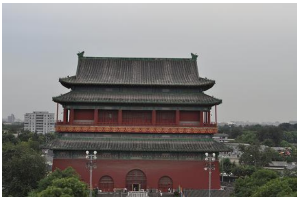
Torre del Tamburo

Le Torri della Campana e del Tamburo di Beijing si trovano a nord della città proibita e tengono le ore per regolare le attività quotidiane. In base al vecchio sistema cinese la notte era formata da 5 geng ognuno dei quali durava 2 ore. Ogni geng era segnato da un colpo di tamburo. Gli ufficiali amministrativi e militari organizzavano tutto in base a questi segnali. Per salire sulle torri è necessario acquistare un ticket per ogni singola torre o per entrambe. La vista dalle torri permette di vedere i sottostanti hutong di Pechino. Sotto le torri vi segnaliamo il Drum & Bell Cafè.