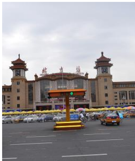
Beijing Railway Station

Per maggiori informazioni sui treni in Cina: www.seat61.com/China.htm