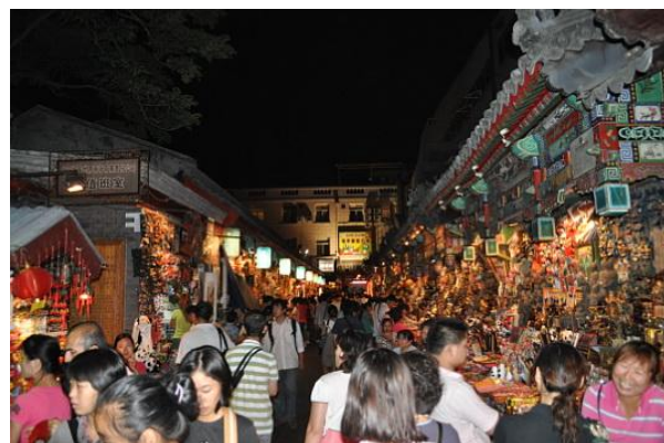
Mercato in Wangfujing Dajie

scorpioni e cavallette disgustosi per noi occidentali, ma molto apprezzati in terra cinese.