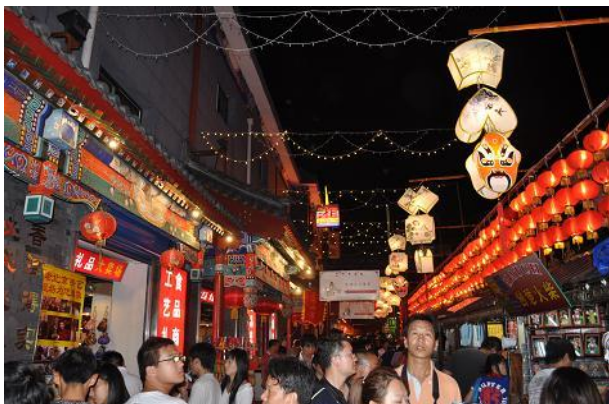
Mercato notturno di Donghuamen

capo di abbigliamento di marca (capi finti ma fatti benissimo). Qui è d'obbligo contrattare e in genere il prezzo finale sarà sempre almeno un decimo del prezzo originale.