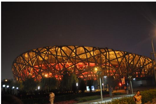
Stadio Nazionale di Pechino

L'Olympic Green è il Parco olimpico di Pechino inaugurato per i Giochi dell'Olimpiade del 2008. In questa grande area è possibile ammirare alcune opere d'arte moderna tra cui lo Stadio nazionale, il Centro Acquatico Nazionale e lo Stadio Coperto Nazionale di Pechino.