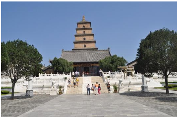
Pagoda dell'oca Selvatica

necessario acquistare un ulteriore biglietto di 20 yaun (10 per gli studenti). La vista dalla pagoda e il relativo complesso meritano una visita.