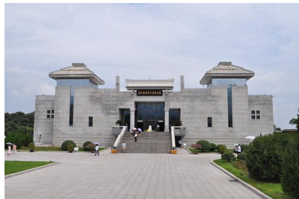
Complesso dell'Esercito di Terracotta

colori accesi ma quando vennero riportati alla luce solo pochi mesi il colore svanì completamente. Per questo motivo molte statue sono ancora coperte. Si continua a lavorare per trovare delle tecniche per preservare il colore e nello stesso tempo per restaurare delle statue danneggiate.