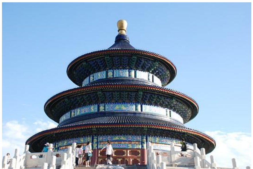
Pechino - Il tempio del Cielo

Pechino è la capitale della Repubblica Popolare Cinese e, al tempo stesso, il cuore culturale e storico della Cina.