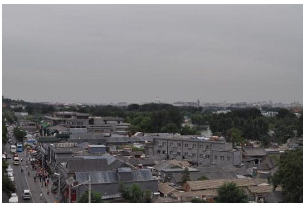
Veduta degli Hutong

Perdetevi lungo gli Hutong, le vie più antiche dell'intera città, ricche di fascino e di storia, peccato solo non potersi fermare e parlare con gli abitanti, visto che, ad eccezione di pochi, i cinesi non parlano una sola parola di Inglese.