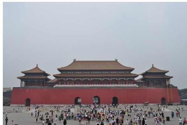
La città Proibita

Per raggiungere la città proibita è possibile prendere la metropolitana e scendere alla fermata omonima 'Tiananmen' oppure gli autobus 1,4,52,57 per Tiananmen.