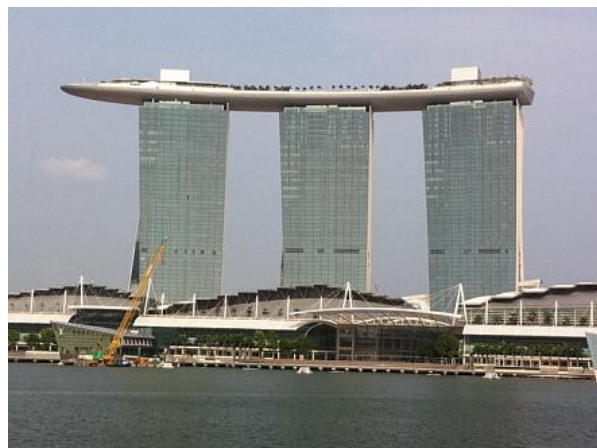
Marina Bay Sands

Sopra le tre torri è appoggiata un'immensa struttura a forma di barca che ospita il Sands SkyPark con giardini, un osservatorio, negozi e una enorme piscina di 150 metri.