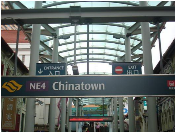
MRT di Chinatown

L'aeroporto principale di Singapore è il Changi International Airport, si trova a soli 20 chilometri dal centro città, la quale si raggiunge facilmente e in diversi modi, prima scelta è la metropolitana, ma anche con bus, shuttle bus, taxi e auto private. Da Singapore è facile raggiungere Kuala Lumpur, con ben tre treni al giorno da e per la capitale Malesiana.