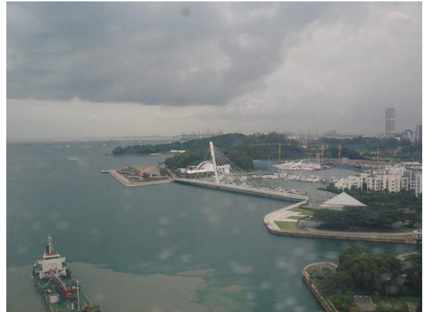
Isola di Sentosa

collegata alla Città Stato grazie ad un ponte. Per raggiungere Sentosa ci sono due possibilità, o tramite un traghetto, o tramite dei bus, quest'ultimi con circa 3 dollari di Singapore e 10 minuti di cammino raggiungono la stazione principale dei bus di Sentosa. Descrivere di preciso Sentosa o cosa si trova a Sentosa, non è per nulla facile.