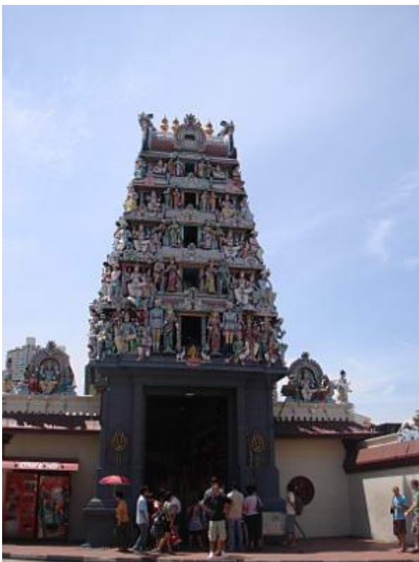
Sri Mariamman Temple

Situato a South Bridge Road, in piena Chinatown, il Tempio di Sri Mariamman è il più antico tempio indù, dedicato alla Dea Mariamman, abile a curare le persone e a favorire la pioggia, tra l'altro, una delle Dee più venerate dai Tamil. Ad ottobre si festeggia il Thimithi, dove i fedeli per festeggiare camminano sui carboni ardenti. In precedenza questo tempio era in legno, soltanto nel 1862 fu costruito l'attuale in pietra e, ogni 12 anni, in contemporanea con le cerimonie di consacrazione, viene rinnovato totalmente.