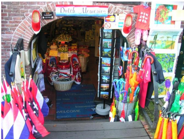
Negozio di Souvenir

I negozi sono aperti dalle 10 alle 18 (fino alle 21 il fine settimana), tutti i giorni tranne il lunedì con orario di apertura dalle 13 alle 18.