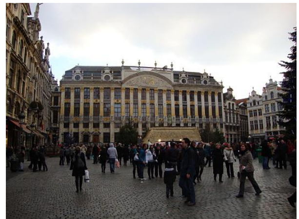
Grand Place - Bruxelles

La zona principale è Grand Place, una delle più belle piazze centrali d'Europa. A sud di Grand Place si trova la famosa Manneken Pis, la fontana con un bambino che fa pipì in una piscina. Tra i vari musei della città, meritano una visita il Museo di Arte Antica e il Museo di Arte Moderna. La via migliore per mangiare prelibatezze è quella di Rue des Bouchers, vicino Grand Place.