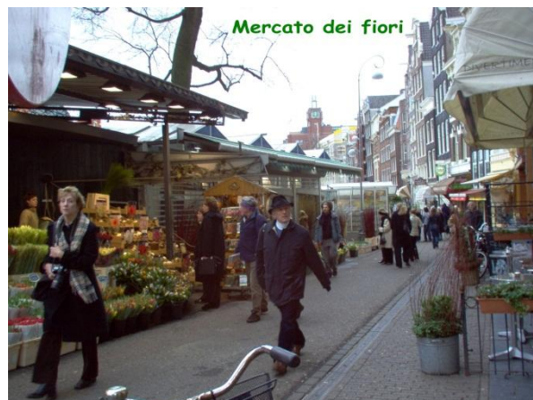
Mercato dei Fiori

centro culturale dove si può ascoltare musica dal vivo con serate a tema.