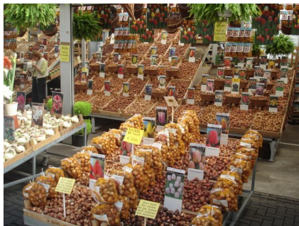
Bancarella del Mercato dei Fiori

A Laidseplein si trova il coffee shop più famoso della città, il Bulldog, ma anche il famoso Heineken caffè e il Comedy Theatre Boom Chicago.