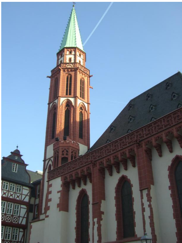
Chiesa di San Nicola

In prossimità del Romerberg si trova l'antica chiesa di San Nicola, caratterizzata dal suono delle campane 2 volte al giorno (alle 9 e alle 12).