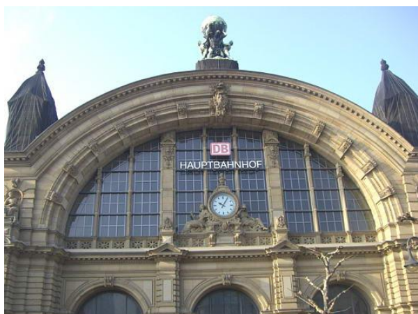
Stazione centrale dei treni

Oltre alla stazione centrale, Francoforte è in grado di offrire molte risorse per gli amanti del trasporto su rotaia, specialmente per i tragitti a lunga percorrenza. Le stazioni sono Frankfurt Main Süd, Frankfurt Main West, Frankfurt Main Ost, Frankfurt-Niederrad, Frankfurt-Rödelheim, Frankfurt-Höchst, Frankfurt Höchst-Farbwerke.