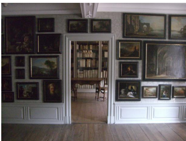
Casa di Goethe

Dove un tempo nacque Johann Wolfgang von Goethe, esattamente il 28 agosto 1749, oggi sorge una casa museo molto interessante. Il museo è situato in Am großen Hirschgraben. Il palazzo datato XVII secolo, quindi in stile barocco, fu letteralmente spazzato via dalla Seconda Guerra Mondiale, ma fu ricostruito fedelmente all'originale.