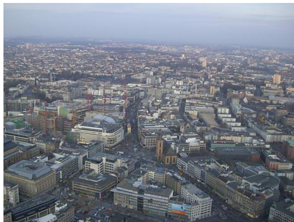
Vista dalla Main tower

E' l’unico edificio della città dotato di una piattaforma panoramica con ristorante pubblico.