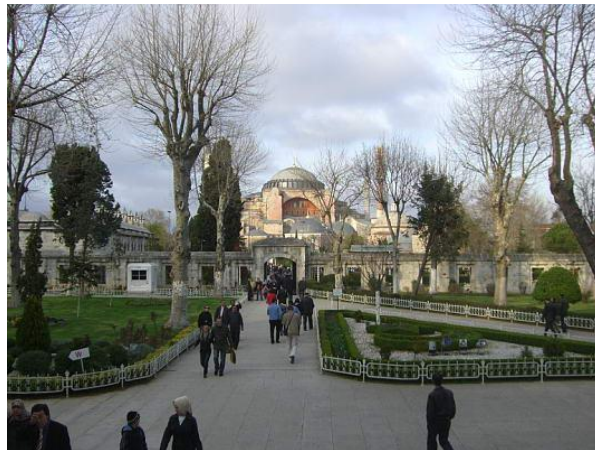
Sultanahmet - Sullo sfondo l'Haghia Sophia

Nel quartiere di Sultanahmet troviamo i due principali simboli della città, l'incredibile chiesa Haghia Sophia (una delle più belle del Mondo con un esempio di Arte Bizantina) e la Moschea Blu che si affaccia in una zona ricca di giardini (piazza Sltanahmet). Questi due bellissimi monumenti si trovano l'uno di fronte all'altro.