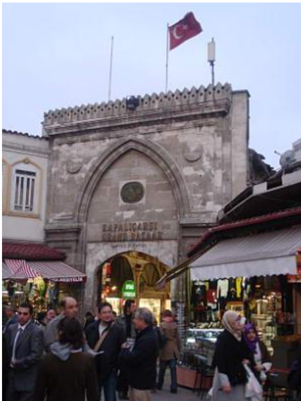
Ingresso al Gran Bazar

Nel variopinto quartiere di Bazar troviamo il vero cuore del commercio cittadino.