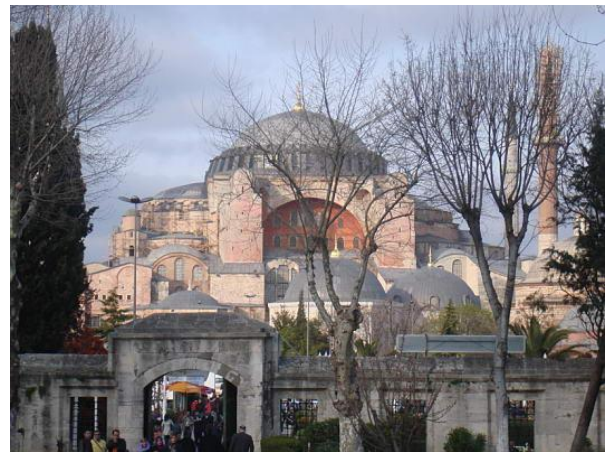
Basilica di Santa Sofia

Candidata per essere una delle nuove migliori meraviglie del Mondo, la Basilica di Santa Sofia fu realizzata nel VI secolo da Giustiniano. Con più di 1400 anni di storia rappresenta la raffinatezza dell'antica capitale bizantina. La chiesa fu trasformata in Moschea dagli ottomani, infatti, in quest'occasione furono costruiti i minareti, le tombe e le fontane che la contraddistinguono. Anche se oggi molto è andato perso, un tempo vi erano stupendi mosaici d'oro al suo interno. La Basilica è un simbolo della città e s'impone con la sua immensa cupola centrale. E' possibile anche visitare un museo con molti esemplari di arte Bizantina (chiuso il lunedì e aperto i restanti giorni dalle 9 alle 16.30).