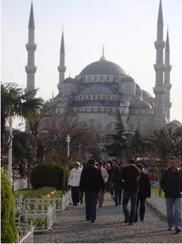
La Moschea Blu

Questo in passato creò molte polemiche perché era visto come un oltraggio e una sfida all'architettura della Mecca. All'interno della Moschea vi consigliamo di vedere le incredibili Piastrelle di Iznik con decorazioni molto sfarzose nel padiglione centrale, poi dirigetevi verso le cupole per ammirare i numerosi dipinti con motivi mesmerici e infine dal cortile è possibile vedere l'elegante cascata di cupole e semi cupole che compongono la Moschea stessa. L'uscita vi porterà in zona dell'ippodromo. Per raggiungere la Basilica è possibile prendere il tram e fermarsi alla fermata Sultamahmet, da qui procedere a piedi verso Sultamahmet Meydani. E' possibile visitare la Moschea tutti i giorni dalle 8:30 alle 12, e dalle 13:45 alle 16:30.