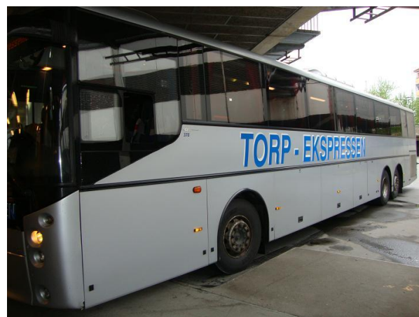
Bus da Torp a Oslo centro

L’autobus Torp-Ekspressen, in corrispondenza dei voli Ryanair, permette il trasferimento da e per Oslo sulle destinazioni Londra, Newcastle, Bergamo, Pisa, Francoforte, Stoccolma, Liverpool e Glasgow. La durata del tragitto è di circa 2 ore.