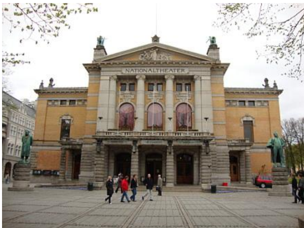
Galleria Nazionale - Nasjongalleriet

La Galleria Nazionale ospita la più vasta collezione nazionale di arte norvegese, dal periodo romantico alle opere moderne, ed è una delle principali attrattive di Oslo.