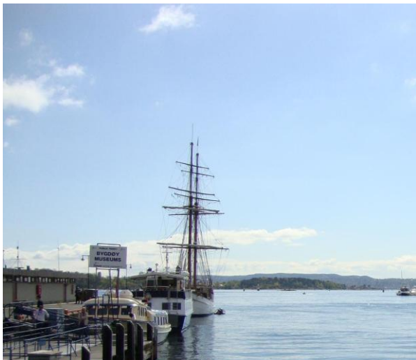
Molo partenza traghetti per Bygdoy

visitare la “Fortezza di Akershus”, l’Opera, e le bellissime isole con le tipiche case in stile norvegese.