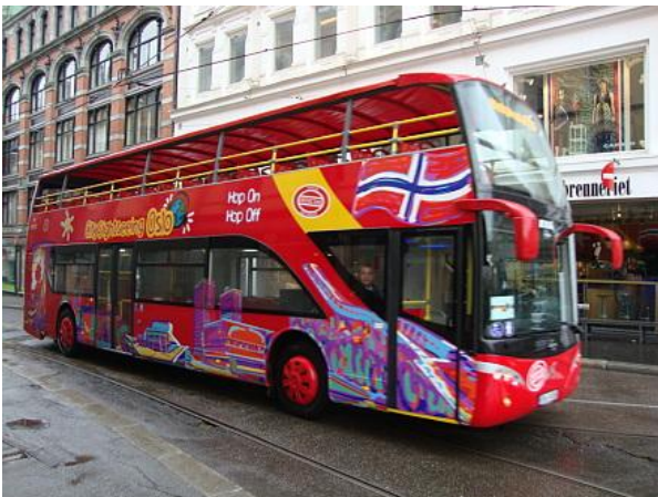
Bus Hop on Hop Off

Uno dei modi più pratici per visitare e vivere la città è con un pratico e comodo tour guidato in bus. In estate ci sono diversi tipi di tour, le guide ufficiali di Oslo vi mostreranno non solo il Parco Vigeland e il Museo delle Navi Vichinghe, ma molto di più.