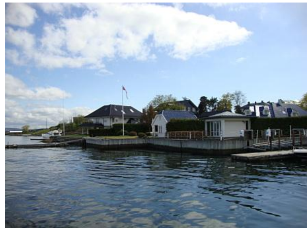
Fiordo di Oslo

Si estende per 100 km dal faro di Færder fino a Oslo. In estate c'è molta vita, tra barche e traghetti che portano i turisti nelle isole limitrofe. Sceglietene una tra Hovedoya, Lindoya, Nakholmen, Bleikoya, Gressholmen e Langoyene. Tutte raggiungibili dal molo di Vippetangen. A Bygdoy ci sono alcune tra le spiagge più belle di Oslo, come Huk e Paradisbukta. Interessante anche il Museo delle Navi Vichinghe e il Museo Kon-Tiki.