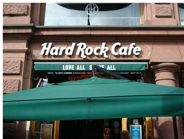
Hard Rock Cafe

Indirizzo: Kirkeveien 57 0368 Oslo, Norge Tel: 22 85 07 00 Sito Web: www.bambusrestaurant.no