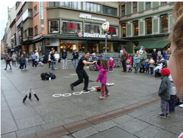
Karl Johans Gate