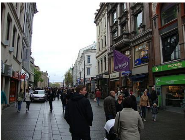
Karl Johans Gate

Si trovano anche centri commerciali come l' Oslo City, il Byporten, il Paléet, il Christiania Glasmagasin e Steen & Strom.