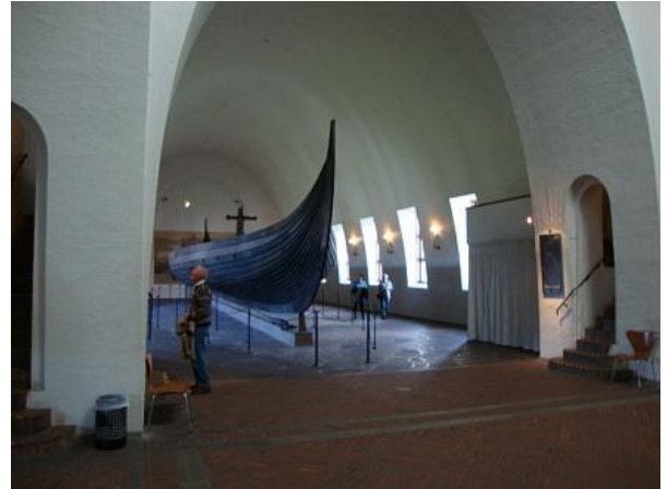
Museo Navi Vichinghe

oppure il traghetto 91 dal molo Radhusbrygge e poi proseguire a piedi.