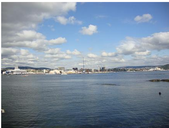
La baia di Oslo

La Capitale norvegese si raggiunge e si gira facilmente con i mezzi pubblici.